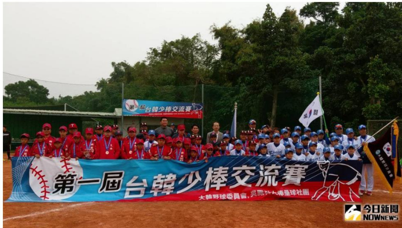
▲吳鳳科技大學棒壘社與韓國TAIKO BASEBALL CAMP，共同主辦第一屆台韓國際青少年棒球錦標賽。

第一屆台韓國際青少年棒球錦標賽，於18日至22日為期5天在吳鳳科技大學棒球場舉行。22日下午於吳鳳科技大學進行決賽。此次賽會由吳鳳科技大學棒壘社與韓國TAIKO BASEBALL CAMP共同主辦，為大學社團舉辦國際賽會活動寫下新頁。