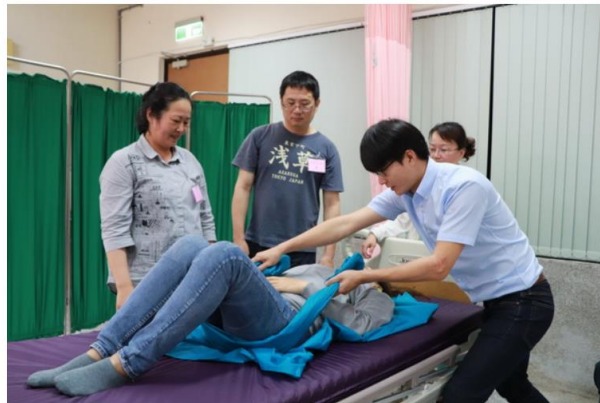
學員利用滑布將病患移位。

http://www.cntimes.info 2019-05-21 20:06:53