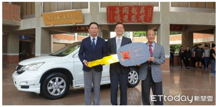
▲▼ 本田汽車為培育本土汽修人才，捐贈實車給吳鳳大學籍以讓汽修科學生更有機會實務學習。