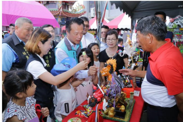
溪口在地創生成果

http://www.cntimes.info 2019-06-02 21:05:38