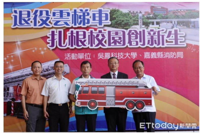
▲嘉義縣消防局、吳鳳科技大學退役雲梯車捐贈儀式。