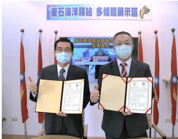
巡署中部分署與吳鳳科技大學6日於海巡署東石海洋驛站，舉行簽署認養合作契約的暨揭牌儀式。

海洋委員會海巡署中部分署與吳鳳科技大學，6日於海巡署東石海洋驛站舉行簽署認養合作契約的暨揭牌儀式，雙方基於推動海洋事務、海洋環境保護及海洋保育教育推廣等理念進行合作；由分署長張志龍與校長蔡宏榮共同簽署，經由雙方合作共同辦理海洋教育展覽、活動，未來將朝更深更廣教育層面進行協力合作。