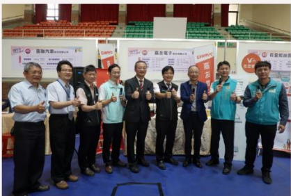
吳鳳科大「2023校園職感薪生活徵才博覽會」