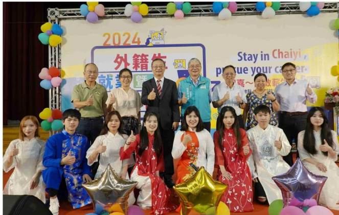
2024外籍生就業暨實習博覽會，吳鳳科大外籍生帶來精彩表演，讓博覽會有著濃厚異國風情。